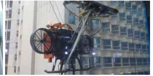
漏水測試 @太古廣場六座