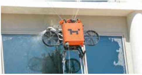
漏水測試 @新加坡科學園 (7 Science Park Drive)