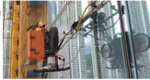
漏水測試 @凱柏峰 (LP11)